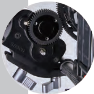
靜音馬達 提供精確的移動