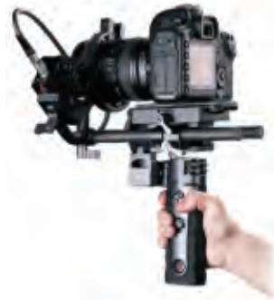
對焦系統簡易操作