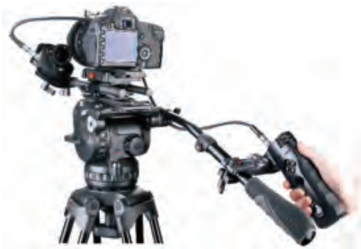
對焦系統+腳架系統