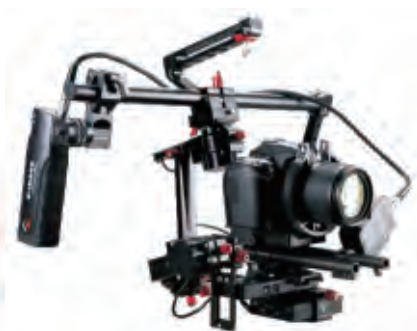
對焦系統和穩定器