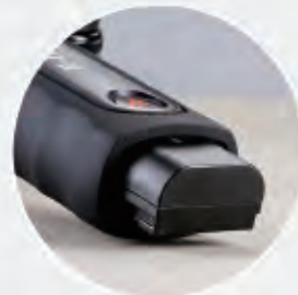
電池可更換和長期保養