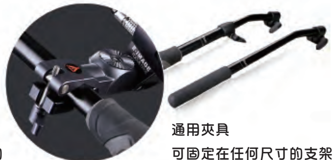
通用夾具 可固定在任何尺寸的支架桿